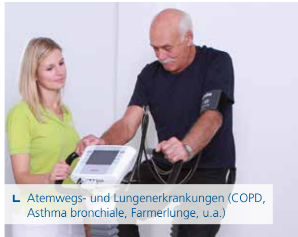
└ Atemwegs- und Lungenerkrankungen (COPD, Asthma bronchiale, Farmerlunge, u.a.)

Rehabilitative Maßnahmen bei Lungen- und Atemwegserkrankungen inkl. Raucherentwöhnung verbessern die Lebensqualität, vermindern Krankheitsfolgen und reduzieren Krankenhausaufenthalte.