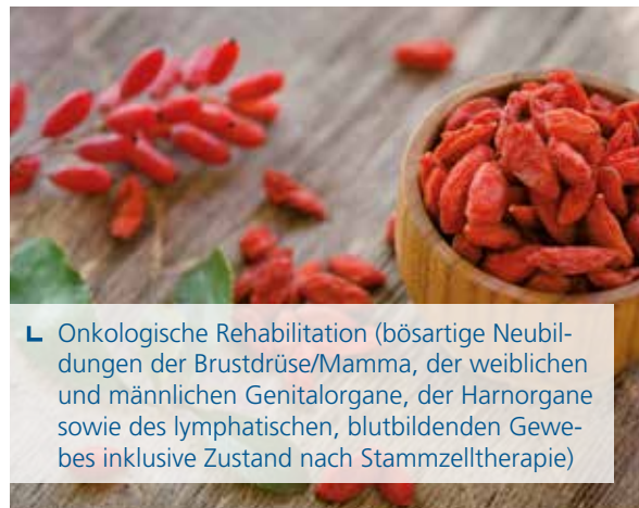
└ Onkologische Rehabilitation (bösartige Neubildungen der Brustdrüse/Mamma, der weiblichen und männlichen Genitalorgane, der Harnorgane sowie des lymphatischen, blutbildenden Gewebes inklusive Zustand nach Stammzelltherapie)

Die onkologische Rehabilitation vermindert tumor- und therapiebedingte Funktionsstörungen (Schmerzen, Müdigkeit, Inkontinenz, Lymphödem, etc.), bietet psychologische Unterstützung bei der Krankheitsbewältigung, verbessert die Lebensqualität, und fördert die Wiederherstellung der Leistungsfähigkeit, die Wiedereingliederung in das Berufsleben und den Erhalt der Selbstständigkeit. Die professionelle Behandlung sekundärer Lymphödeme sowie von Wundheilungsstörungen ist eine weitere Domäne der onkologischen Rehabilitation.